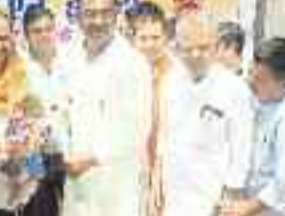
सम्मानित करते भाजपा जिला उपाध्यक्ष।