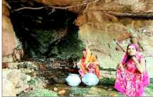
चढ़ान से पानी भरती महिलाएं।

गुरुवार को छग व्यवसायिक परीक्षा मंडल रायपुर द्वारा गुरुवार को पीईटी/पीपीएचटी प्रवेश परीक्षा का आयोजन जिला मुख्यालय बैकुण्ठपुर में किया गया। इस बार इंजीनियरिंग कॉलेजों में प्रवेश के लिए पीईटी में कुल दर्ज परीक्षार्थियों में से आधे से भी कम परीक्षार्थी परीक्षा में शामिल हुए। जानकारी के अनुसार पीईटी परीक्षा में 39.85 प्रतिशत ही परीक्षा में सम्मिलित हुए। इसी तरह दूसरे पाली में पीपीएचटी की परीक्षा आयोजित की गई। इसमें भी में आधे से कम परीक्षार्थी सम्मिलित रहे। इस परीक्षा में 45.34 परीक्षार्थी ही परीक्षा में सम्मिलित हुए। परीक्षा समन्वयक से मिली जानकारी के अनुसार प्रथम पाली में पीईटी परीक्षा के लिए पीजी कॉलेज बैकुण्ठपुर को परीक्षा केन्द्र बनाया