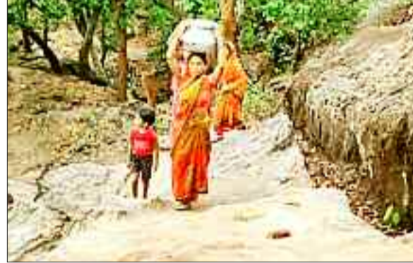
पहाड़ की चढ़ाई कर ले जाती है पानी।