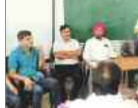
बैठक में उपस्थित अधिकारी व शिक्षक।

खिलाकर सम्मान करना है। आयोजन में पालकों, जन-प्रतिनिधियों को आमंत्रित किया